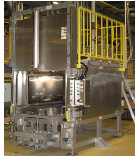
前扉式自動開閉型装置（CMS-A）