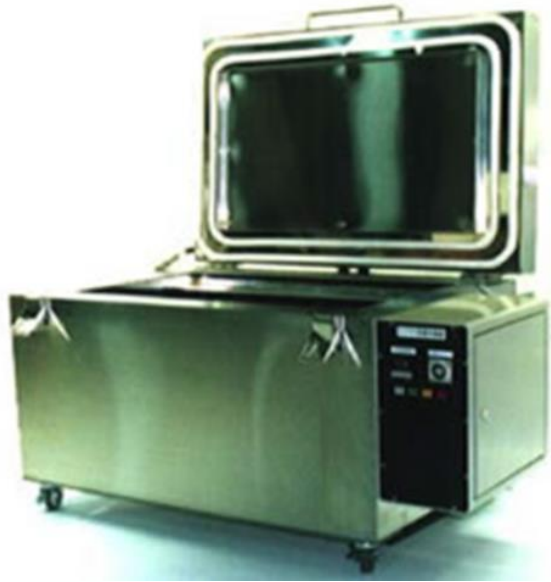
上扉手動開閉型装置（CMS-M）